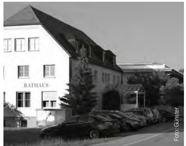
Der Bereich vor dem Rathaus mit Parkplätzen und Gehweg soll eine neue Gestaltung erhalten.

Der „Planungsverband Äußerer Wirtschaftsraum München“ soll Eckpunkte für eine Diskussionsgrundlage zur Neugestaltung der Außenanlagen des Rathauses liefern. Von Bedeutung ist der Bereich um den Parkplatz, die Einbindung des Gehweges, ein barrierefreier Zugang und die Gestaltung im Westen und im Süden. Der Gemeinderat wollte nicht das ganze Vorhaben in Auftrag geben, sondern zuerst eigene Vorstellungen zusammen mit den Beiträgen des Verbandes im Bauausschuss besprechen. Das ist mit neun gegen sechs Stimmen beschlossen worden.