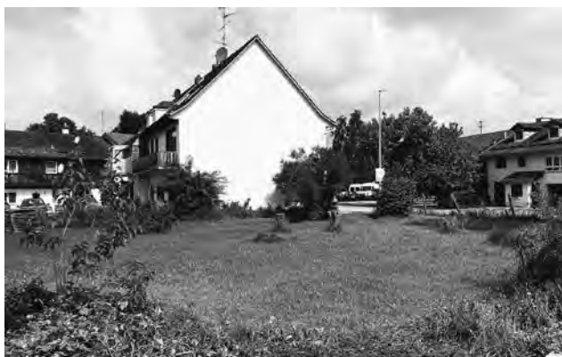
Container sind für dieses Grundstück geplant.

Um den Ablauf für die Genehmigung des Lagerplatzes abzukürzen, ist das einstimmig von einem Freistellungs- in ein Baugenehmigungsverfahren umgewandelt worden. Denn geprüft werde dabei die Verträglichkeit des Vorhabens mit dem Mischgebiet und das sei in der Form schneller. Das Ja zum Bauantrag fiel mit vier gegen zwei Stimmen aus.