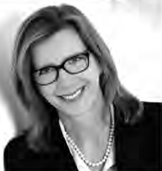
MARTINA WESSELING IMMOBILIEN